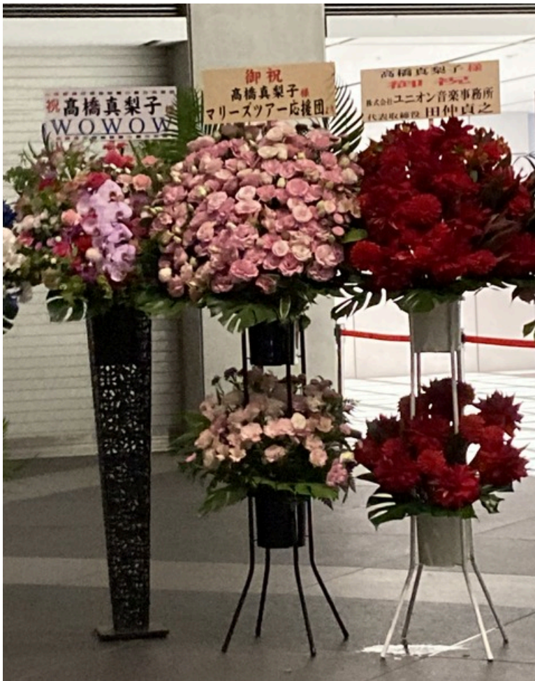
高橋真梨子さん えこひいきはしない 方です。 歌を伝える職人なん